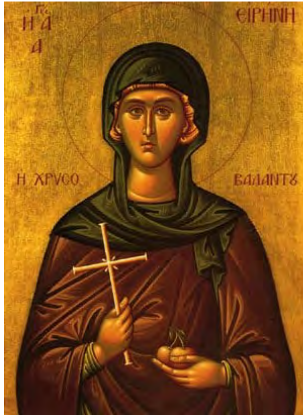
Saint Irene of Chrysovalantou ✠ Η Αγία Ειρήνη η Χρυσοβαλάντου