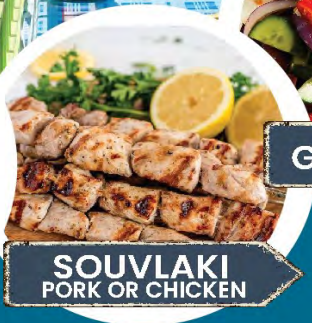
SOUVLAKI PORK OR CHICKEN