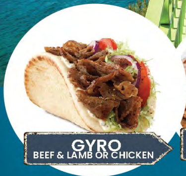
GYRO BEEF & LAMB OR CHICKEN